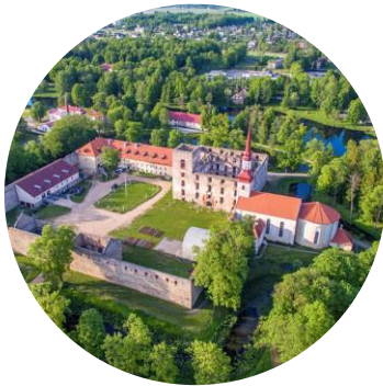
LOSS LOSSIPÄEV MAGNUS LIIVIMAA PEALINN