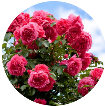
ROOSID ROOSISAAR ROOSIAED ROOSILINN