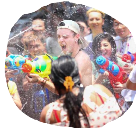
Vee- ja jõesündmused