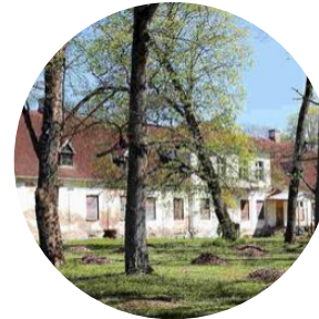
MÕISAD UUE-PÕLTSAMAA LUSTIVERE TAPIKU ADAVERE VÕISIKU