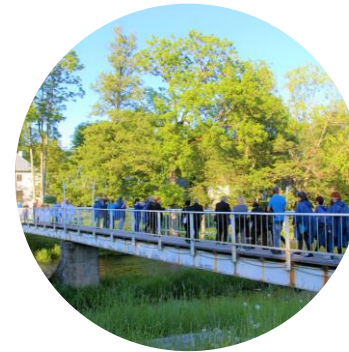
SILLAD 19 SILDA SILDADE PÄEV