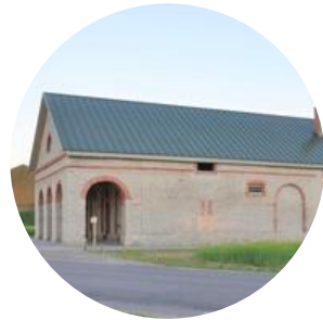
PAJUSI TAASTATUD KÜLAKESKUS LÕÖTSAPÄEV MASINAPÄEV MUDAJOOKS