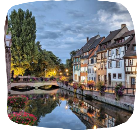
Linn näoga jõe poole