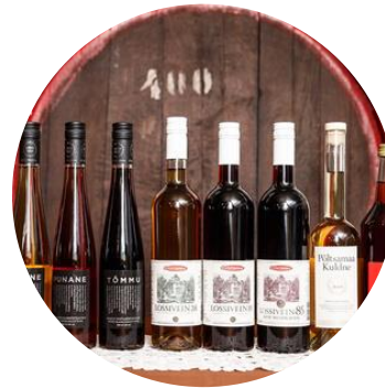
VEINID VEINIKELDER EHTNE JA HEA KOSMOSETOIT