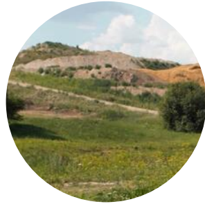
KUNINGAMÄGI KARDIRADA TERVISERAJAD SUUSAMÄGI