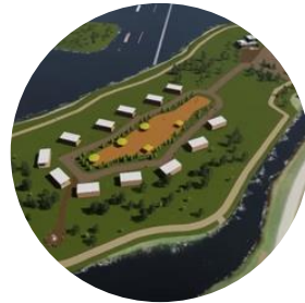
KAMARI VEELAUAKESKUS KÜLASELTS JÄRV