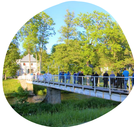
Sillad kui sümbol