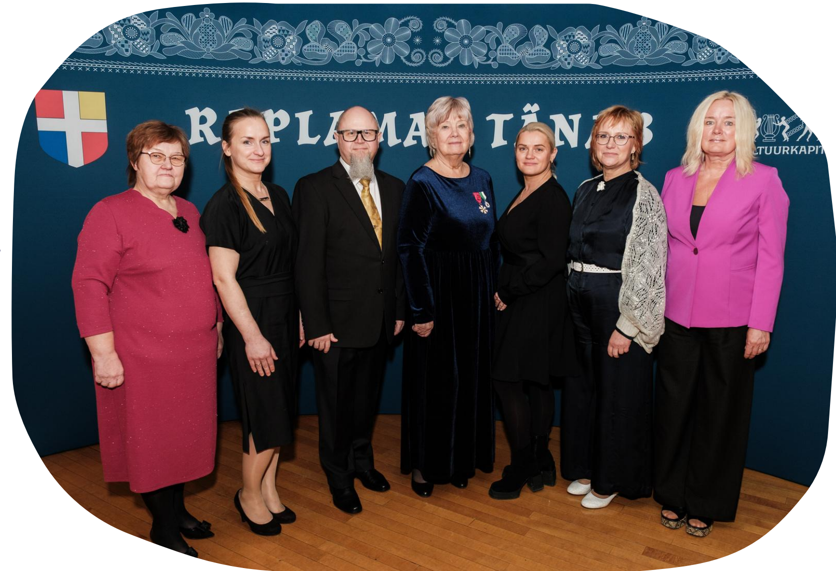
ROLi büroo töötajad