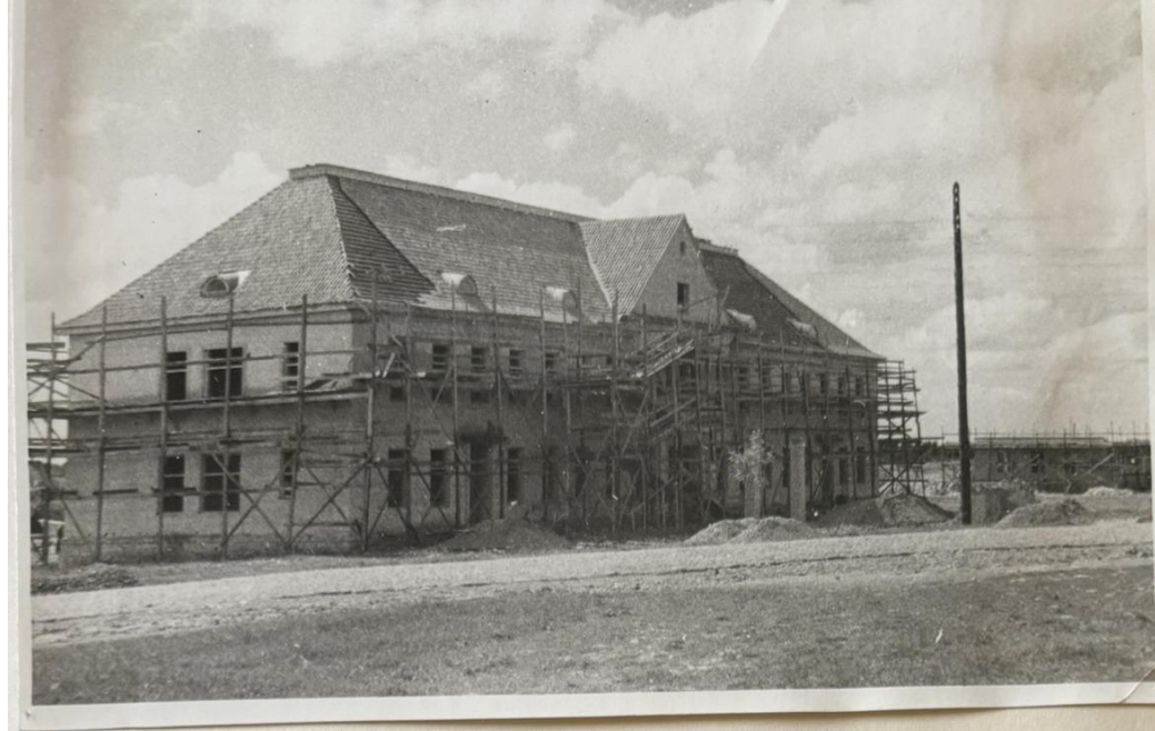
Haigla ehitus 1952 a.